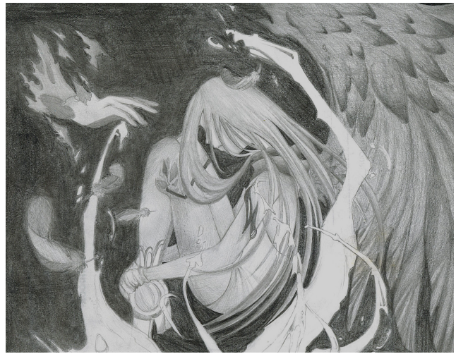
火鳳凰—王五童 (Tina Wang) 作