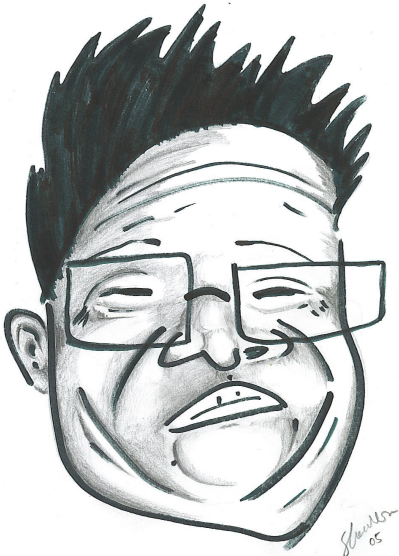
朝鮮人民的偉大領袖金正日—魏安達 (Shawna Wei) 作